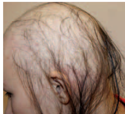
Рис. 6. Диффузная алопеция