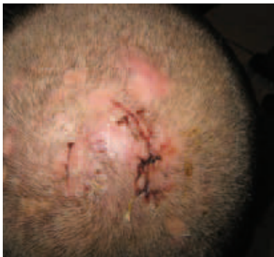
Рис. 4. Абсцедирующий подрывающий фолликулит и перифолликулит Гоффманна