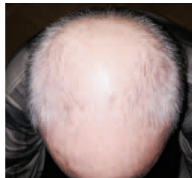
Рис. 7. Андрогенетическая алопеция