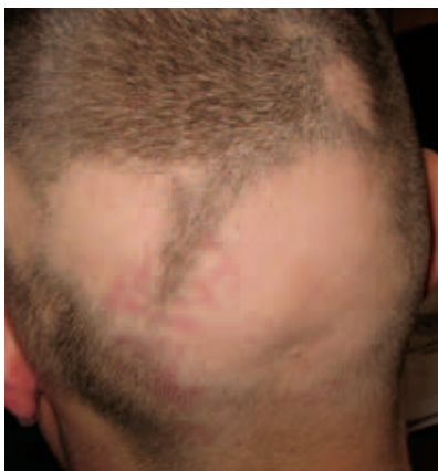
Рис. 5. Гнездная алопеция