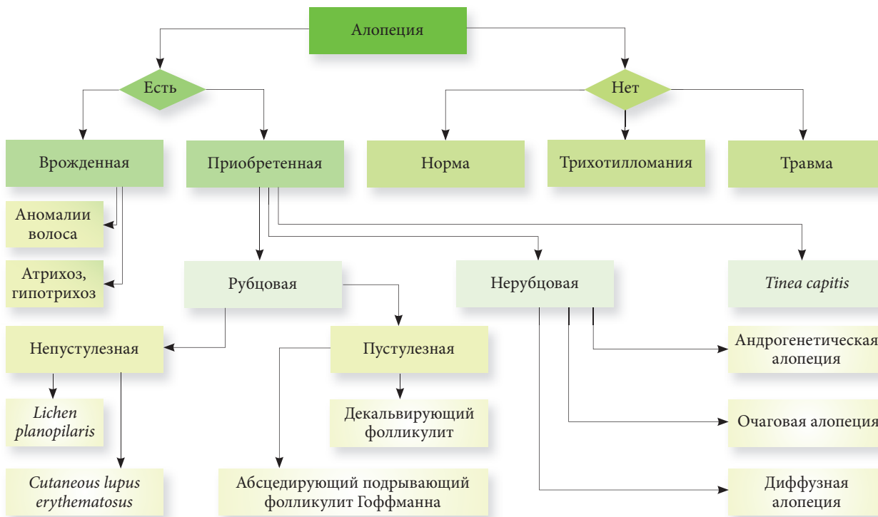
Рис. 1. Диагностический алгоритм при алопеции

цовые изменения отсутствуют. В практике можно использовать диагностический алгоритм, представленный на рис. 1.