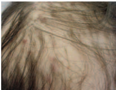
Рис. 3. Lichen planopilaris