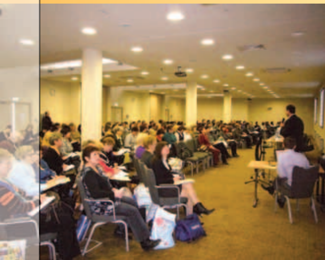
Более 200 врачей из всех районов Самарской области собрались на научно-практическую конференцию «Рациональная фармакотерапия в педиатрии»