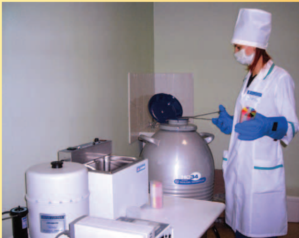
Новейший программный замораживатель спермы и эмбрионов Freeze Contorl CI – 8800 (Cryologic-) Австрия. Возможность криоконсервации спермы и эмбрионов, хранение их в течение длительного времени.