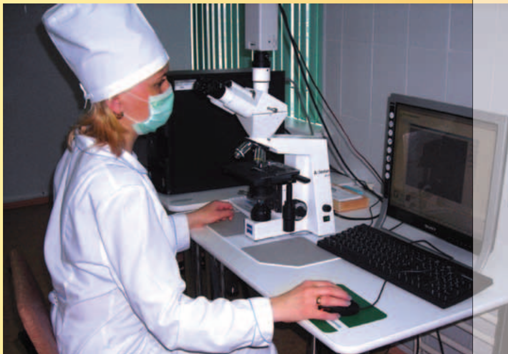
Компьютерный анализатор спермы Видео-Тест-Сперм 2.1 – рабочее место врача-эмбриолога. Позволяет производить углубленный анализ эякулята. Состоит из микроскопа Karl Zeiss (Германия), компьютера Gateway (США), специального программного обеспечения Видеоест (Россия).