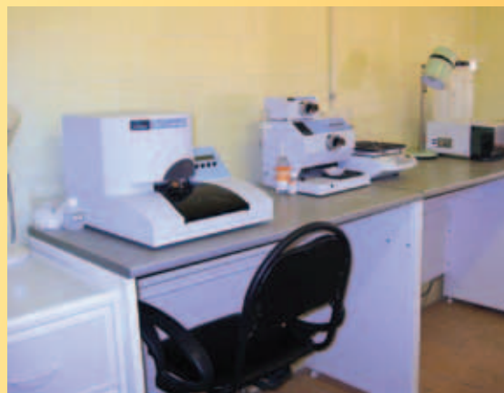
Медико-генетическая консультация Областной клинической больницы: лаборатория неонатального скрининга

В ЦРБ Вышнего Волочка работает только одна реанимационная койка для новорожденных. За счет оборудования, полученного в рамках программы «Дети России», и за счет средств, полученных из Резервного фонда президента – 1 млн 700 тыс. рублей – мы развернем здесь еще 2 реанимационные койки. В ЦРБ Вышнего Волочка есть отделение патологии новорожденных, в котором осуществляется второй этап выхаживания, больница сможет обслуживать близлежащие районы – Торжокский, Спировский, Фировский и Бологовский. ➔