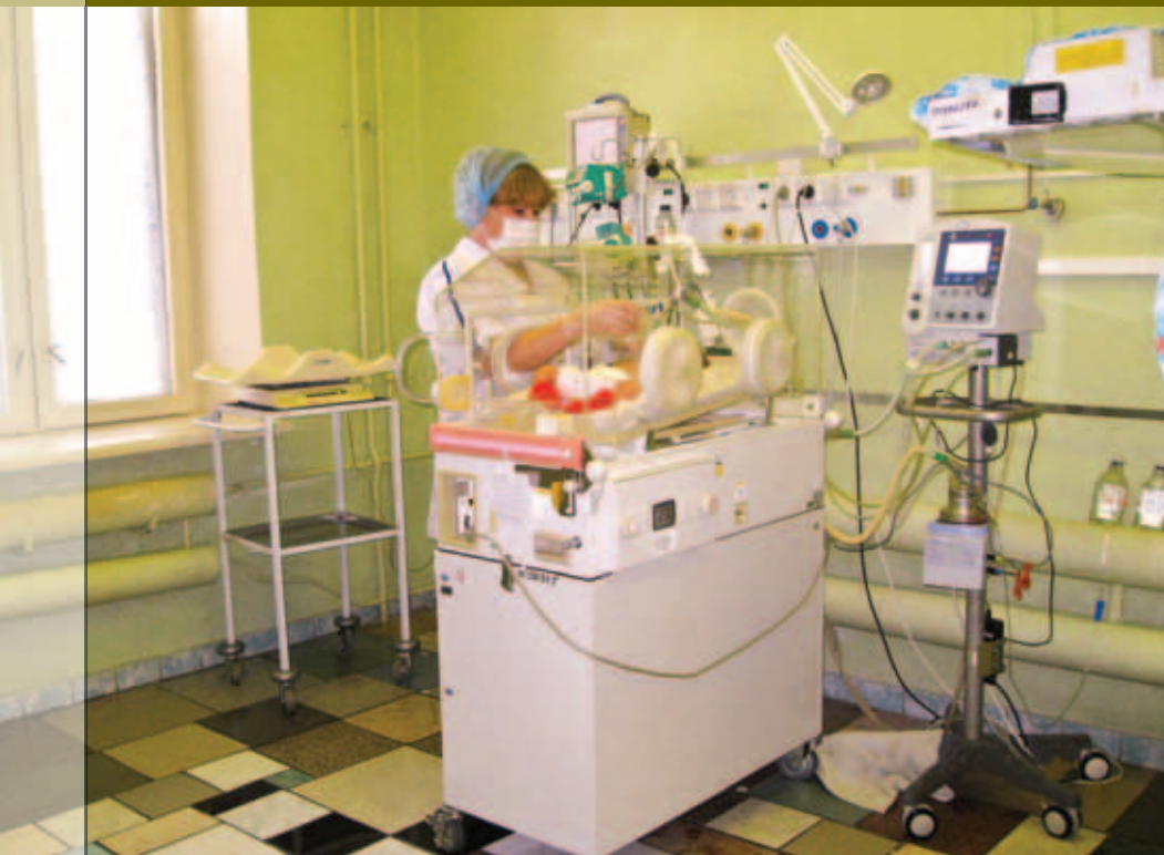
Отделение патологии новорожденных Детской городской клинической больницы № 1 г. Твери: реанимационное место

Всего в регионе действует 13 реанимационных коек, но этого явно недостаточно. Обеспеченность реанимационными местами у нас составляет 0,7 койки на 1000 родов, в то время как стандарты, рекомендуемые Минздравсоцразвития, – 2-4 койки на 1000 родов. С открытием Перинатального центра, в котором будут оборудованы 12 реанимационных коек, и со сдачей нового корпуса ДОКБ в старом корпусе больницы на освобожденных площадях мы сможем оборудовать еще 6 реанимационных мест и мы покроем потребность области в реанимационной помощи. Большое значение в развитии реанимационной помощи на местах имеет обеспеченность современным оборудованием. Средства родовых сертификатов позволили большим межрайонным центрам приобрести аппараты ИВЛ. Пока не во всех районах области есть аппараты дыхания под положительным давлением, но постепенно ситуация выправляется. Небольшим районам, имеющим недостаточное финансирование, мы купили 11 таких аппара-