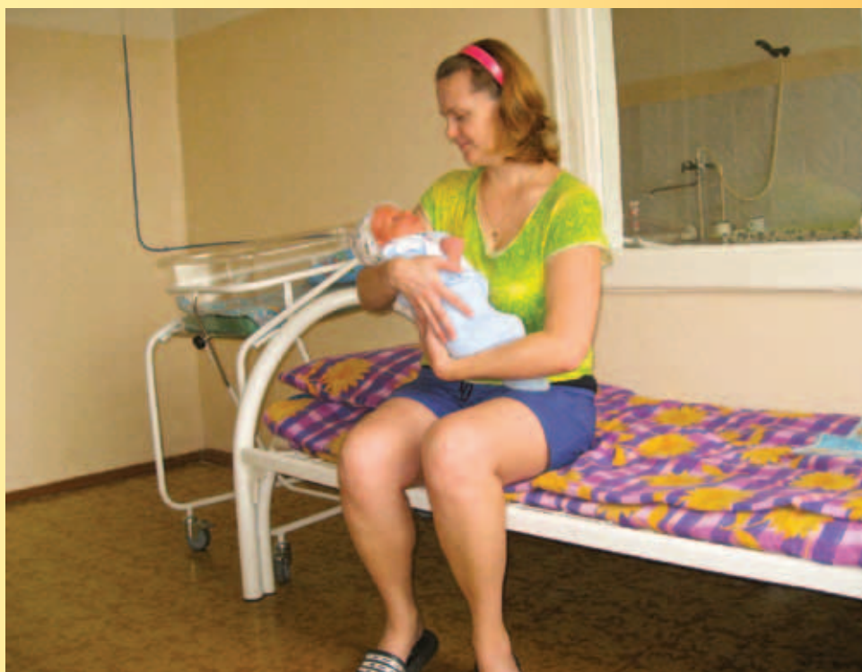
Палата «Мать и дитя» в Детской городской клинической больнице №1 г. Твери