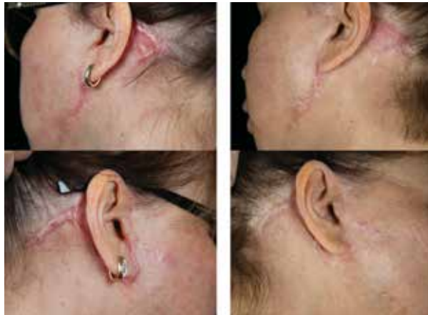
Рис. 2. Пациентка Б., 55 лет, послеоперационный рубец до (слева) и через шесть недель лечения (справа)