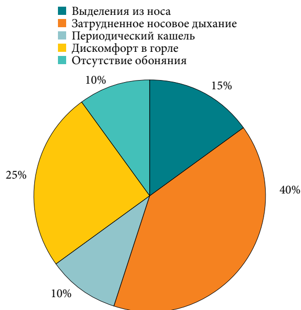
Рис. 1. Доля видов нарушений со стороны лор-органов, %

Возраст обследованных пациентов составил от 18 до 65 лет, средний возраст – 44 \pm 0,7 года, что говорит о преобладании жалоб на храп и в ряде случаев – на остановки дыхания во сне у лиц трудо-