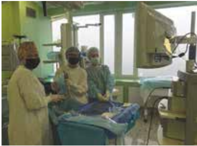
Проведение высокотехнологичной операции сотрудниками кафедры в клиническом центре челюстно-лицевой, реконструктивно-восстановительной и пластической хирургии