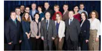
Коллектив кафедры оториноларингологии МГМСУ им. А.И. Евдокимова

На кафедре проводится обучение студентов лечебного и стоматологического факультетов, факультета среднего профессионального образования, а также постдипломное обучение врачей-оториноларингологов. В педагогической работе сотрудники