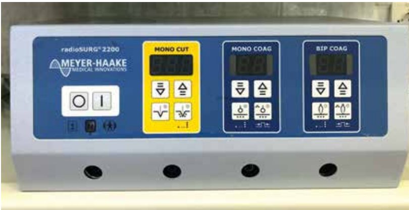
Рис. 2. Радиоволновой аппарат radioSURG 2200