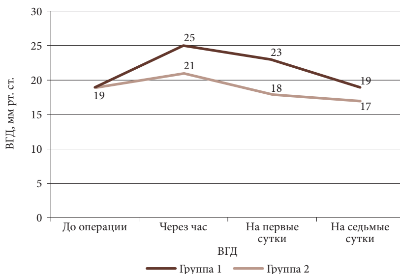
Рис. 2. Уровень реактивной гипертензии в динамике

тия угла и трабекуло-радужковый угол, по данным ультразвуковой биометрии [13].