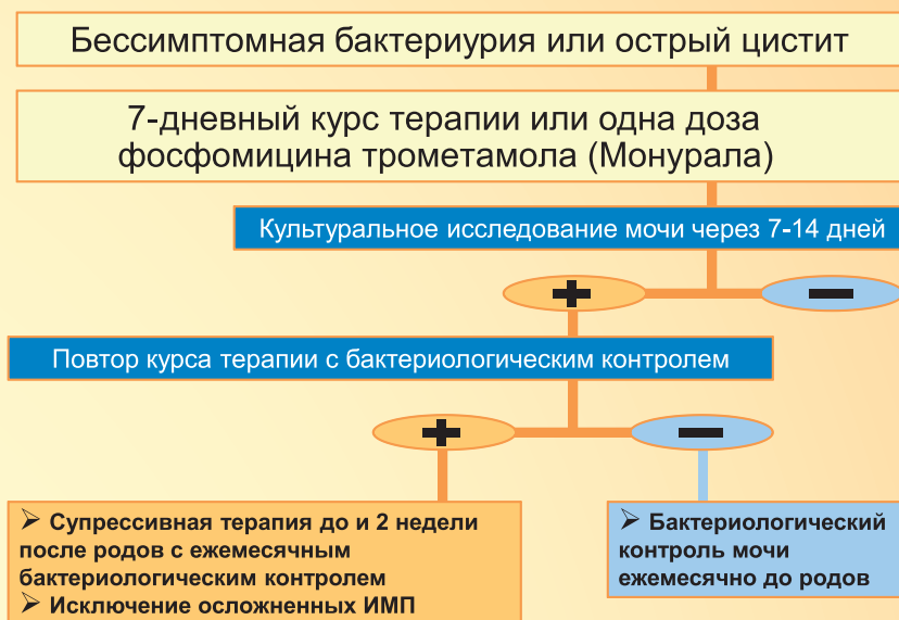
Рисунок 3. Ведение беременных с инфекцией нижних отделов МВП

– мониторинг жизненно-важных функций – респираторный дистресс, септический шок; – парентеральное назначение антибиотиков; – в случае отсутствия улучшения в течение 48-72 часов есть два решения. Первое связано с обструкцией мочевых путей. И тогда это хирургическое лечение, т.е. катетеризация мочеточников или оперативное лечение мочекаменной болезни. Если это резистентность микроорганизмов, то необходима смена антибиотиков под постоянным бактериологическим контролем. И, наконец, это супрессивная терапия до окончания беременности и две недели после родов.