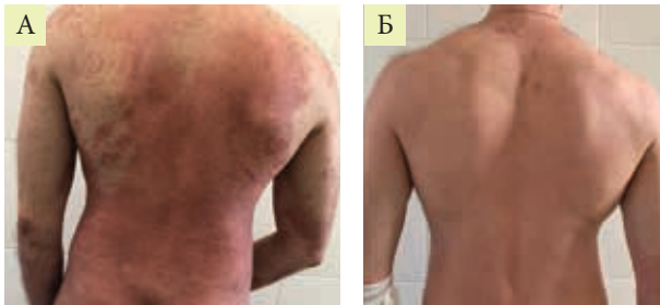
Рис. 1. Пациент В. с вульгарным псориазом до лечения (PASI 37) (А) и через три месяца (PASI 1) (Б)

В ходе наблюдения нами было установлено, что лечение больных вульгарным псориазом тяжелой степени с использованием секукинумаба в дозе 300 мг (подкожно по установленной схеме) позволяет достичь высокой эффективности при хорошей переносимости, в том числе в тех случаях, когда ранее проведенное лечение не обеспечило стойкого удовлетворительного результата. ●