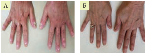
Рис. 3. Пациентка Б. с вульгарным псориазом и псориазической ониходистрофией до лечения (NAPSИ 44) (А) и через пять месяцев (NAPSИ 4) (Б)