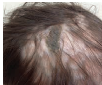
Рис. 2. Пациент К. через месяц лечения