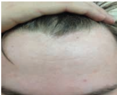
Рис. 6. Пациент Б. через восемь месяцев лечения

Диагноз: атопический дерматит, детский возрастной период, сквамозно-пруригинозная форма, средняя степень тяжести, асбестовидный лишай (рис. 1).