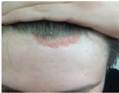
Рис. 4. Пациент Б. до лечения