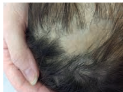
Рис. 3. Пациент К. через шесть месяцев лечения