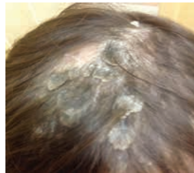
Рис. 1. Пациент К. до лечения

При осмотре: распространенный патологический процесс. Кожа туловища и конечностей сухая, в локтевых сгибах мелкие незначительные папулезные высыпания до 0,1–0,2 см. В теменно-височной области толстые серовато-коричневые плотно прилегающие корки и очаги облысения.