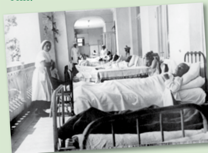
ПАЛАТА В НИИ ИМ. И.М. СЕЧЕНОВА

и лечения различных заболеваний, которые широко применяются в лечебных и санаторно-курортных учреждениях всего мира, заложены основы медицинской реабилитации, физиотерапии и курортологии.