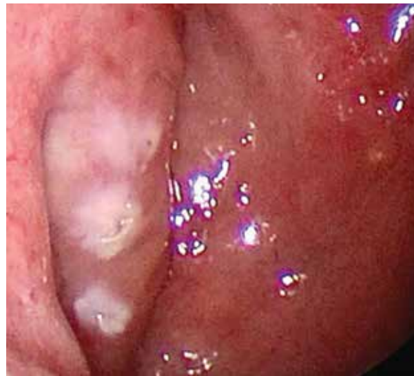
Рис. 3. Эндоскопическая картина состояния тубарного валика слева после радиоволнового воздействия