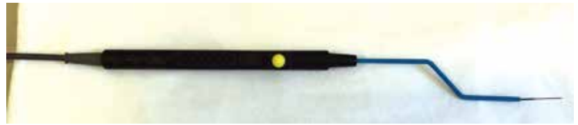
Рис. 1. Монополярный электрод для лор-органов

Всем пациентам выполняли тональную пороговую аудиометрию до лечения, а также на 7-й, 30-й и 180-й дни от начала лечения. Статистически достоверной разницы между группами до начала лечения, по данным аудиометрии, не установлено ( p > 0,05 ). Таким образом, можно отметить, что по срокам нормализации показателей тональной пороговой аудиометрии лидируют пациенты второй группы. Показатели аудиометрии во второй группе достоверно ( p < 0,05 ) превосходят таковые в первой группе на 7-й и 30-й дни от начала лечения. На 180-й день достоверной разницы по показателям между группами не зафиксировано (табл. 1).