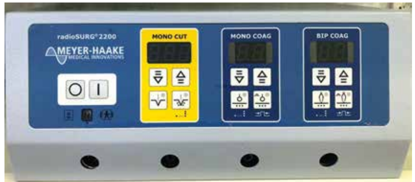
Рис. 2. Радиоволновой аппарат RadioSURG 2200