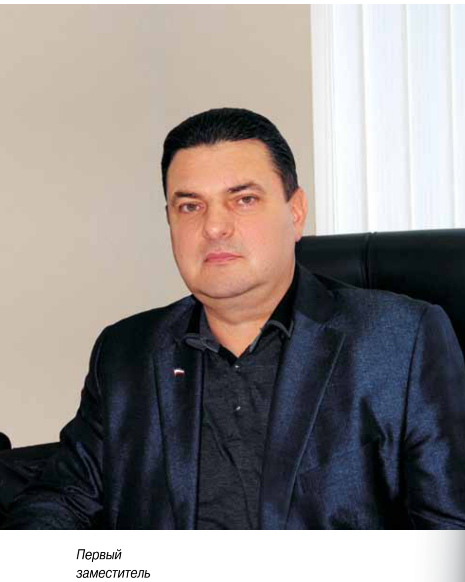
Первый заместитель министра курортов и туризма Республики Крым И.А. Котляр