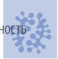
Таблица 1. Факторы, влияющие на развитие эндокринных остеопатий