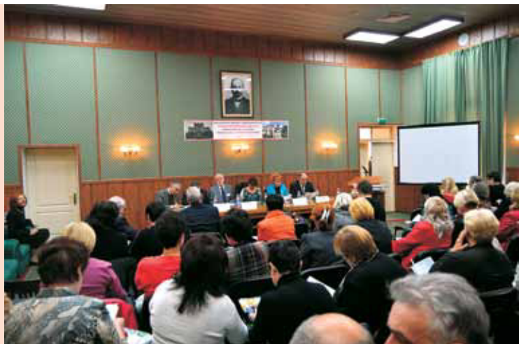
В ЗАЛЕ КОНФЕРЕНЦИИ

В Крымском научно-исследовательском институте физических методов лечения и медицинской климатологии им. И.М. Сеченова состоялась юбилейная научно-практическая конференция «Актуальные вопросы физиотерапии и курортологии», посвященная 100-летию одного из старейших медицинских научно-исследовательских учреждений России