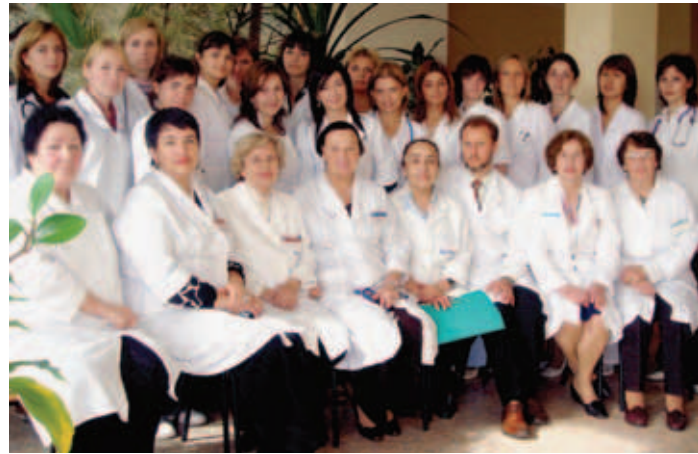
Нынешние сотрудники и курсанты первой в России кафедры последипломного образования врачей-педиатров – кафедры педиатрии РМАПО