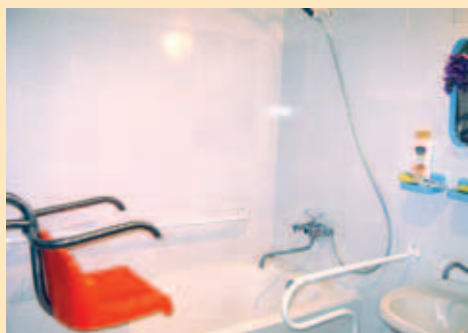
Ванная, оборудованная специальными поручнями