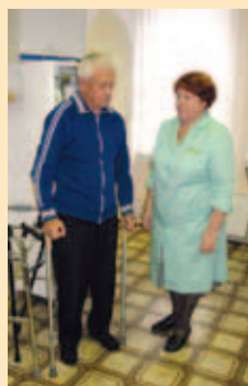
Подбор индивидуальных средств опоры