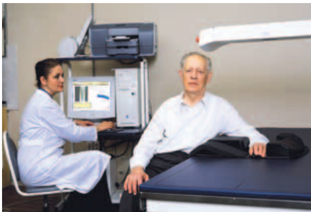
Рис. 1. Обследование на костном денситометре Hologic Delphi W