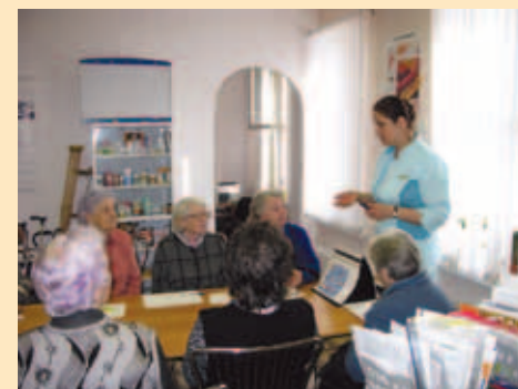
Работа Школы пациентов с остеопорозом