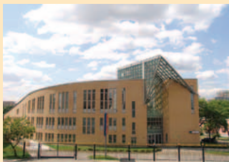
Социально-реабилитационный центр ветеранов войн и Вооруженных Сил

значены контрастным цветом, подготовлены номера со специальными поручнями в ванной комнате и туалете. В центре есть прекрасно оборудованный спортивный зал, укомплектованный современными тренажерами, и комфортный плавательный бассейн, оснащенный по последнему слову техники. Современная аппаратура, установленная в физиотерапевтических кабинетах, позволяет проводить различные процедуры.