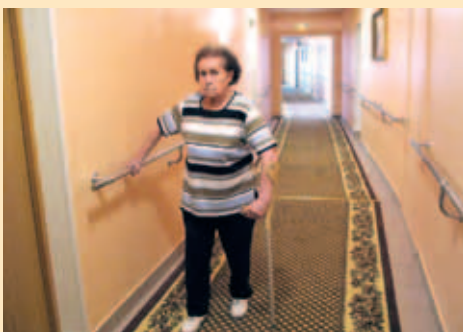
Специальные поручни в коридоре