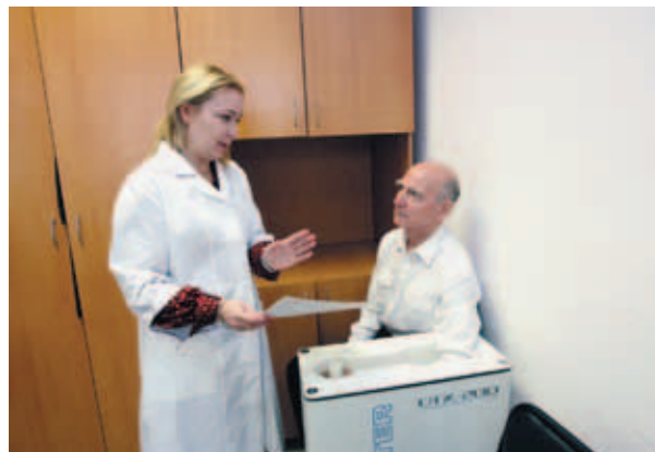
Рис. 2. Денситометрическое обследование на аппарате Osteometer DTX-200

программа медико-социальной реабилитации больных с костно-суставной патологией.