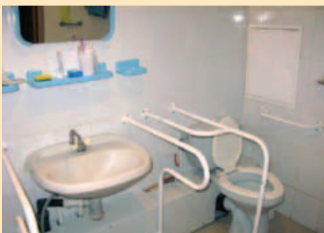
Специальные поручни в туалете