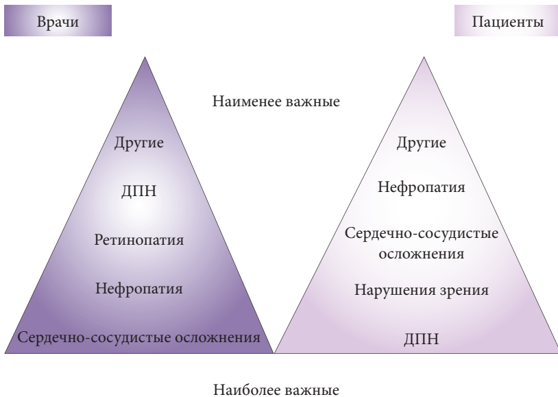
Рис. 2. Ранжирование осложнений СД по степени значимости

нию больных с диабетической полиневропатией: патогенетическая и симптоматическая терапия. Патогенетическая терапия направлена на снижение не только невропатических симптомов, но и на улучшение невропатического дефицита, приводящего к развитию диабетической стопы. Патогенетическое лечение включает назначение альфа-липоевой кислоты (например, Октолипен), комбинированных препаратов витаминов группы В (например, Комбилипен табс) и препаратов на основе гемодеривата. Симптоматическая терапия направлена на ликвидацию основных проявлений ДПН, наиболее часто назначаются анальгетики, снимающие невропатическую боль. С учетом анализа литературных данных, а также результатов проведенного анкетирования врачей и пациентов можно сделать вывод, что идеальный препарат для лечения диабетической полинейропатии должен обладать следующими свойствами: