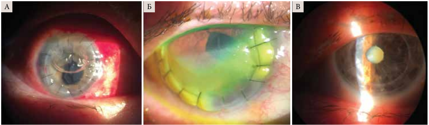
Рис. 2. Процесс эпителизации роговицы после сквозной кератопластики с применением СФЕРО®око (А – эпителизация на вторые сутки; Б – эрозия в нижних отделах роговицы на четвертые сутки; В – спустя шесть месяцев после кератопластики – трансплантат прозрачный)