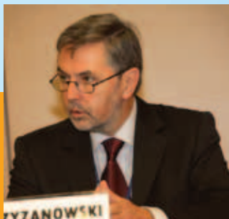
Представитель ВОЗ М.Г. Кржижановский