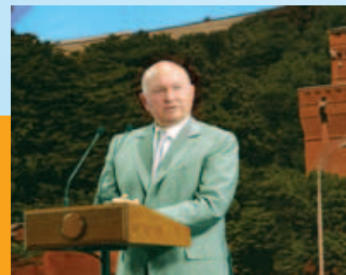
Мэр Москвы Ю.М. Лужков