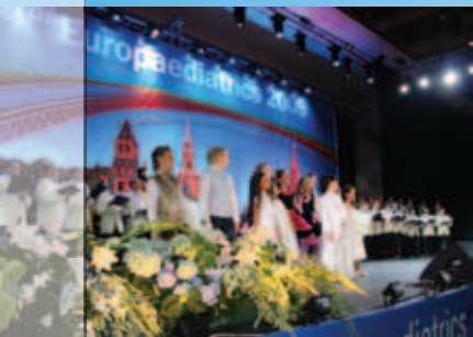
Торжественное открытие Euroaediatics-2009, 3 июня 2009 г., Москва, Манеж