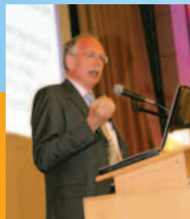
Председатель Научного комитета IV Европейского конгресса педиатров И. Эйрих