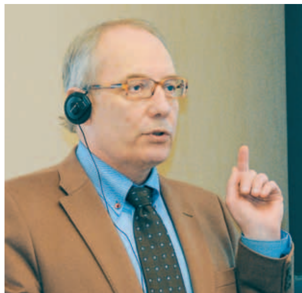
Профессор Тари Хаахтела

В результате реализации программ удалось многого достичь. Так, расходы на лечение БА в Финляндии в 2007 г. (2 млн евро) оказались ниже, чем в 1987 г., хотя число больных и применение лекарств возросло. Однако благодаря более раннему выявлению заболевания достигнута существенная экономия за счет сокращения числа госпитализаций. С 2000 по 2010 г.