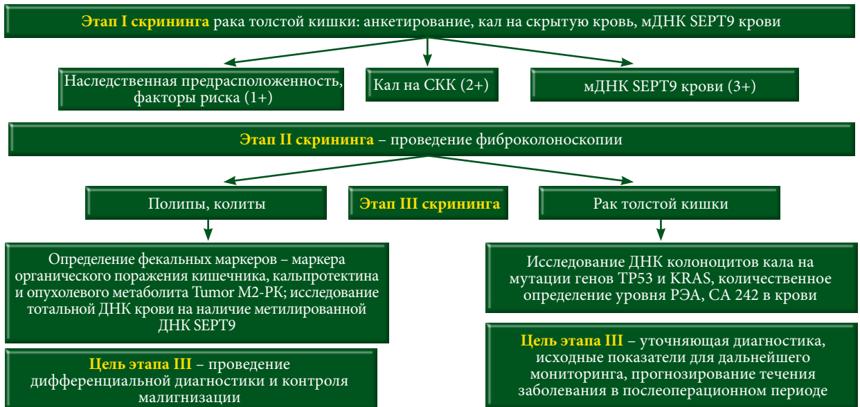
Рис. 2. Роль молекулярно-генетических исследований в проведении скрининга рака толстой кишки

На базе НМИЦ онкологии (Ростов-на-Дону) совместно с Областным консультативно-диагностическим центром выполнено научное исследование «Клинико-экономическое обоснование скрининга и ранней диагностики рака толстой кишки»