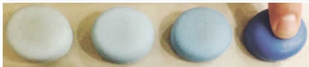
Рис. 2. Твердость полового члена пациента П. на фоне лечения (по шкале твердости эрекции)

Заключение: нормоспермия, олигозооспермия I степени, астенозооспермия