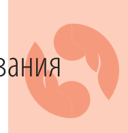
Таблица 3. Анализ особенностей течения беременности